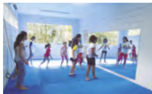
Atividades são desenvolvidas na sede da ASSOCIAÇÃO DOS AMIGOS e espaços cedidos por instituições colaboradoras