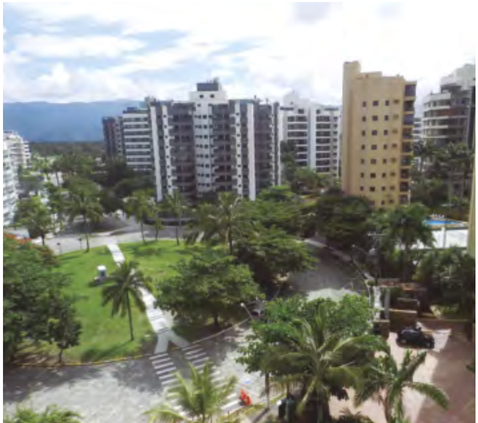
Cuidados com o patrimônio incluem cadastros atualizados por proprietários de casas e apartamentos

Atualmente, as tecnologias disponíveis no mercado são muitas e com as mais diferentes funções (sensores que detectam quebras nos vidros, por meio de ondas sonoras; outros que registram a presença de estranhos rondando o local; há câmeras de segurança com aplicativo no celular, que possibilita o monitoramento do imóvel em tempo real, sendo útil para as ações