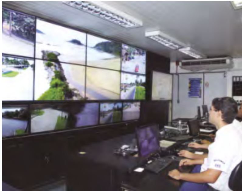
Vídeomonitoramento nas áreas públicas: auxílio na vigilância

Aos proprietários de imóveis na Riviera (casa ou apartamento), a ASSOCIAÇÃO DOS AMIGOS DA RIVIERA lembra a importância de manterem os cadastros atualizados; aos que já utilizam sistemas de segurança eletrônicos, orienta para que as prestadoras dos serviços particulares tenham esses recursos em conexão com o sistema do Serviço de Segurança da ASSOCIAÇÃO DOS AMIGOS, cuja vigilância atua também observando as movimentações suspeitas, acionando o Policiamento sempre que identificadas situações que ofereçam algum risco à segurança pública.