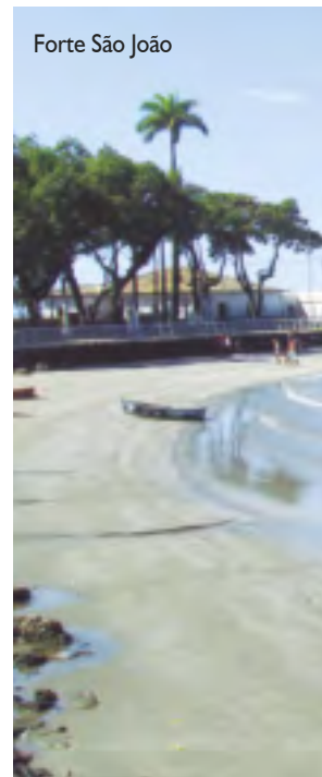
Forte São João

tos turísticos, como píeres, marinas, e os manguezais. São os rios e suas grandes extensões um dos passeios mais apreciados para estudos dos manguezais, contato com a natureza e prática da pesca amadora.