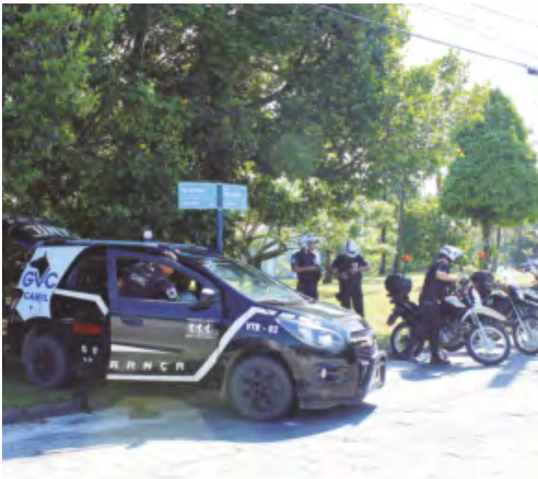
Ações permanentes do serviço de segurança da ASSOCIAÇÃO na vigilância e prevenção de ocorrências