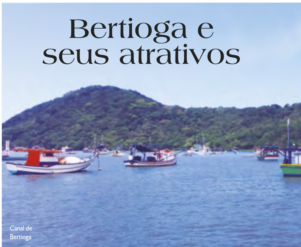
Canal de Bertioga

O Canal de Bertioga, que recebe as águas do Rio Itapanhaú, é considerado excelente local para a pesca e dele pode-se avistar outros pon-