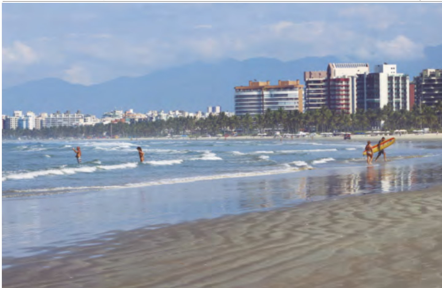
Riviera conta atualmente com mais de 11.300 unidades habitacionais, shopping Center, escolas, centros comerciais e de serviços