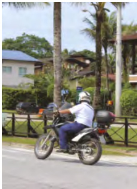
Serviço de Segurança realiza rondas diárias

mais imediatas em caso de eventual violação nos imóveis.