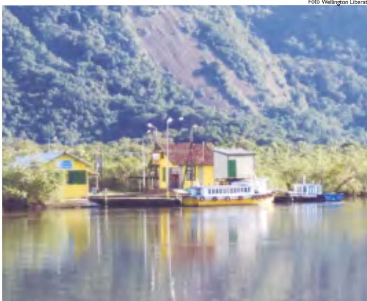
A Vila de Itatinga é outro patrimônio de Bertioga. Autêntica vila inglesa, construída em 1910, abriga a primeira usina hidrelétrica do País, fornecendo energia para o Porto de Santos até os dias atuais.