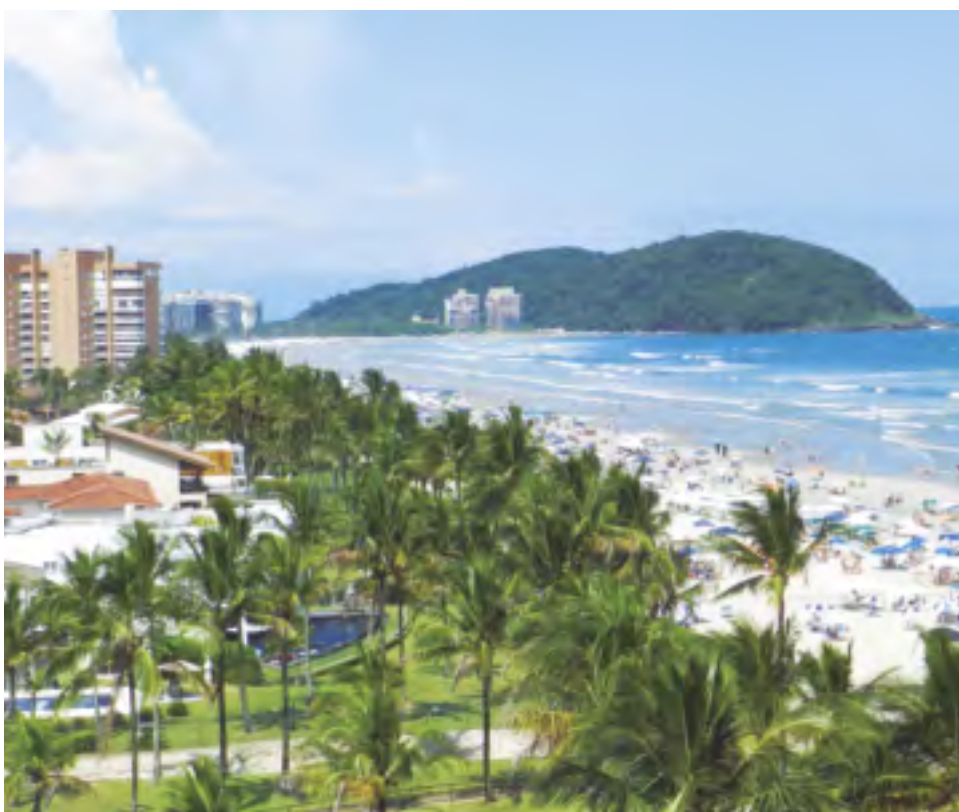
Certificada como Município Verde Azul, Bertioga mantém em suas praias bom padrão de qualidade